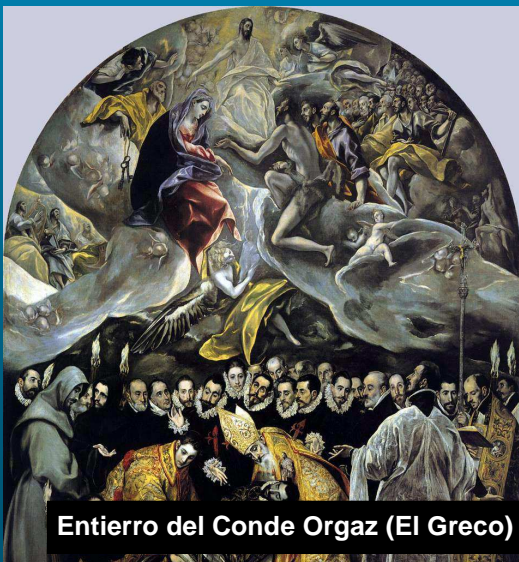
Entierro del Conde Orgaz (El Greco)

http://www.toledosefarad.org/JUDERIA/blanca.php