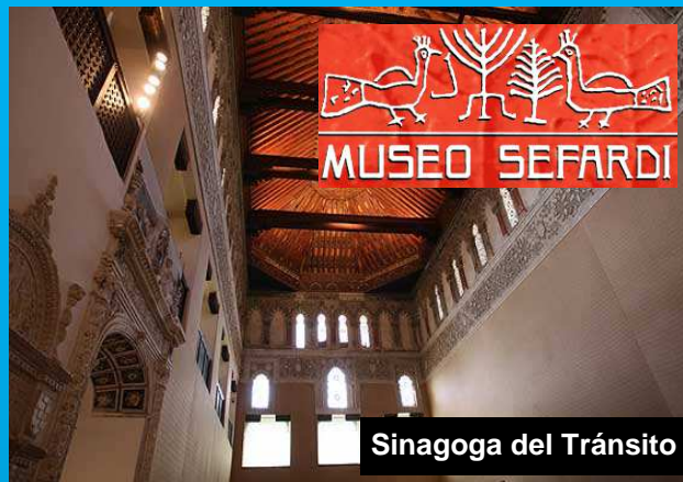
Sinagoga del Tránsito