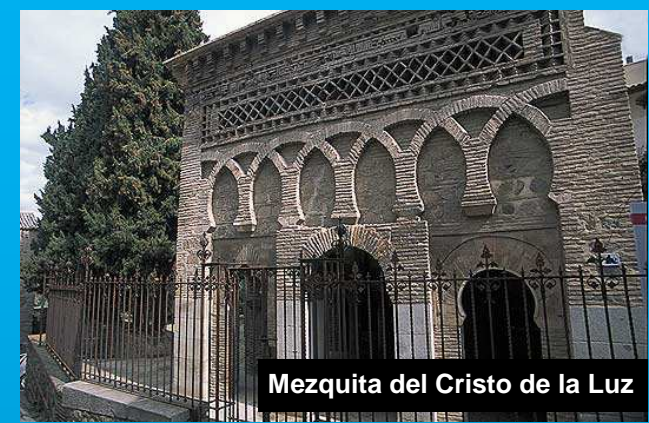
Mezquita del Cristo de la Luz