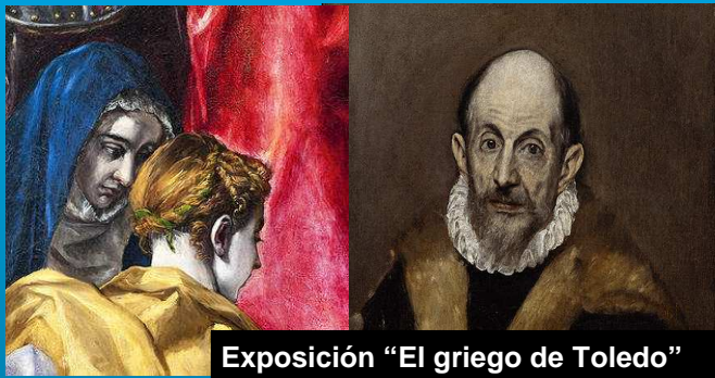
Exposición "El griego de Toledo"