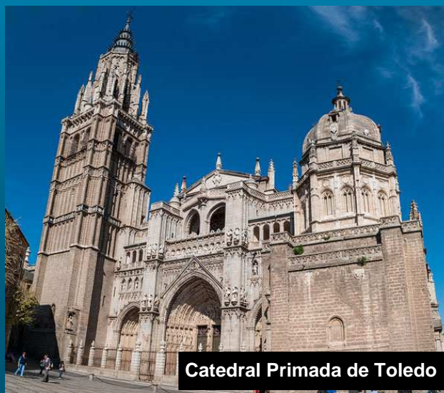
Catedral Primada de Toledo

http://www.architoledo.org/catedral/Default.htm