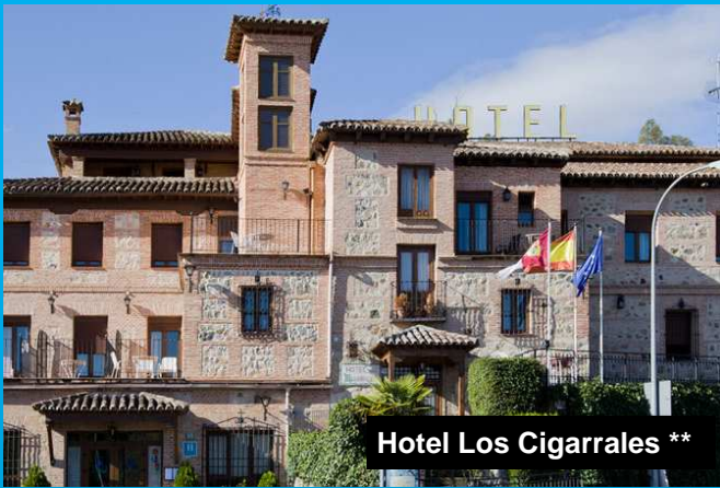
Hotel Los Cigarrales **