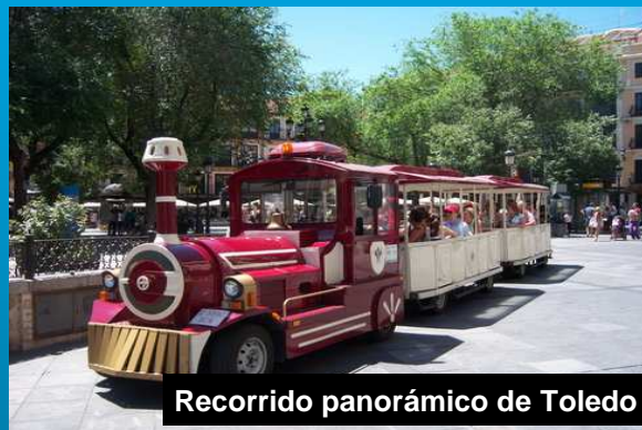
Recorrido panorámico de Toledo