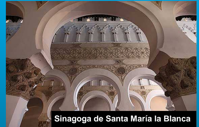
Sinagoga de Santa María la Blanca

http://www.toledosefarad.org/JUDERIA/blanca.php