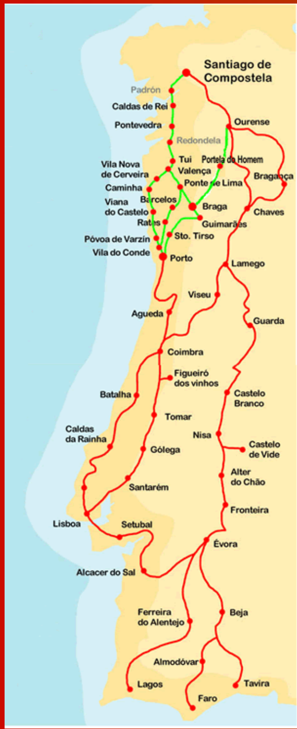
O Caminho Português

Nos alojaremos en el Albergue Juvenil de GUIMARAES, perteneciente a la Red Internacional de albergues juveniles.